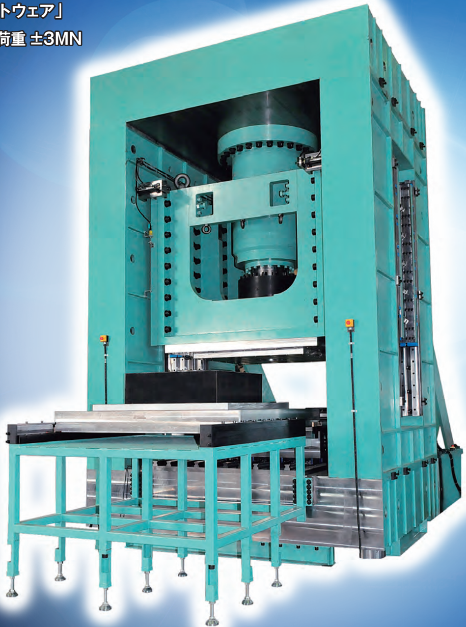
免震ゴム用大型 2 軸試験機 MCS-10M/3M